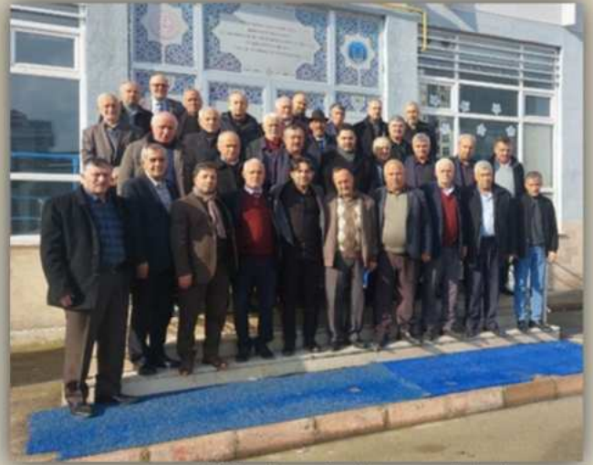
Eğitime katılan muhtarlarımız

çocukların hızına yetişebilmek, onları daha iyi anlayabilmek ve doğru iletişim kurabilmek adına katıldıkları kursun büyük katkısının olduğunu belirttiler.