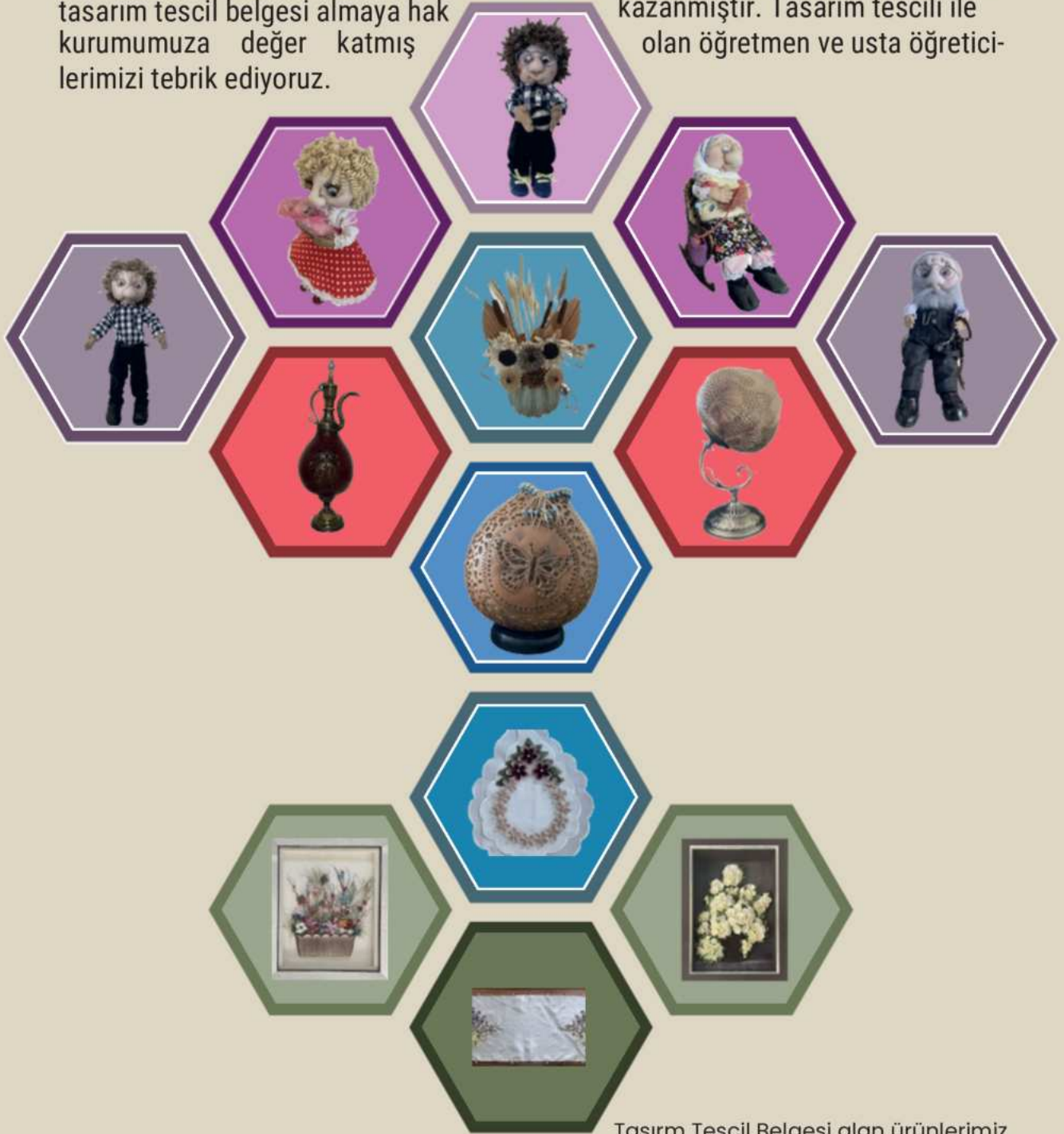
Tasarm Tescil Belgesi alan ürünlerimiz

El emeğini göz nuru ile birleştiren, Anadolu'muzun kültürünü tasarımlayarak somutlaştıran değerli öğretmen ve usta öğreticilerimizin yapmış oldukları 13 ürün tasarım tescil belgesi almaya hak kurumumuza değer katmış lerimizi tebrik ediyoruz.